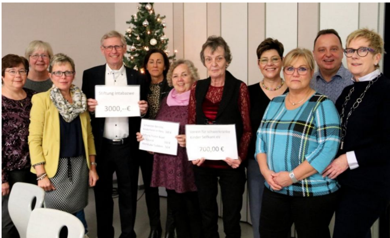
De Missionsgruppe verdeelt de giften aan de verschillende ontvangers

De jaarlijkse Advents- en Weihnachtsbasar vond plaats op zondag 25 november in de Westzipfelhalle in Tüddern. De bazaar werd druk bezocht en wij ontvingen van de organiserende Missionsgruppe Tüddern € 3.000,- uit de totale opbrengst. De Missionsgruppe (en daarmee ook de vrijwilligers én de bezoekers van de bazaar!) is onze grootste sponsor.